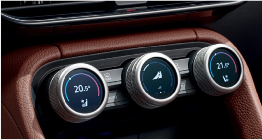
Función Smart Dial con botones personalizables según la necesidad