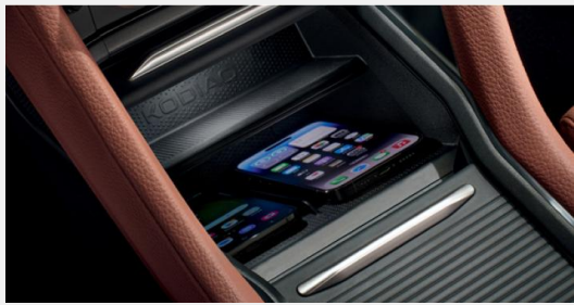
Phone Box carga inalámbrica para 2 teléfonos de manera simultánea