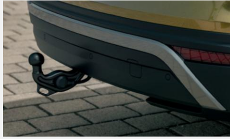
Incluye gancho de remolque retráctil eléctricamente