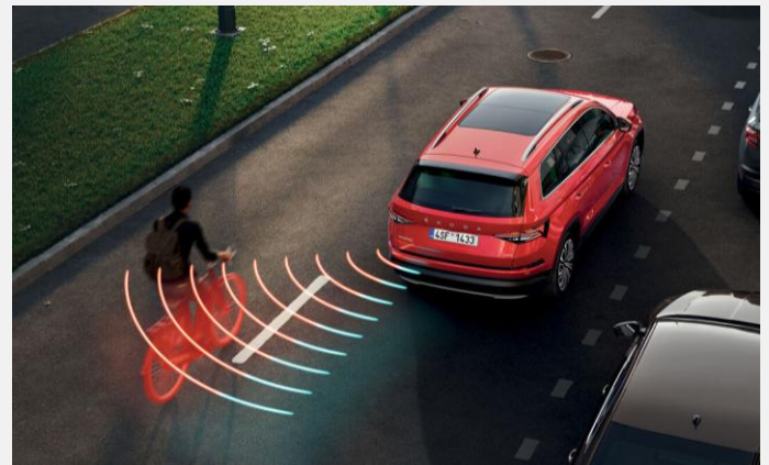
Side Assist: asistente de cambio de carril