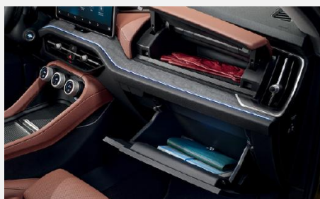
Doble guantera: superior e inferior, para maximizar el espacio de almacenamiento