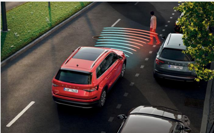
Front Assist: Sistema de frenado automático