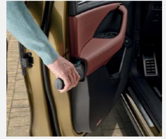
Paraguas en la puerta del conductor